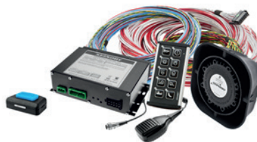
Ersätter Mini Blå

ljus, backljus, m m. Samtliga funktioner manövreras via en 5-tums touchpanel (T5) och man kan komplettera med P1 enknappspanel nära ratten eller ytterligare en T5-panel vilket ger ökade användarmöjligheter. 10-30V. ECE R10 (EMC).