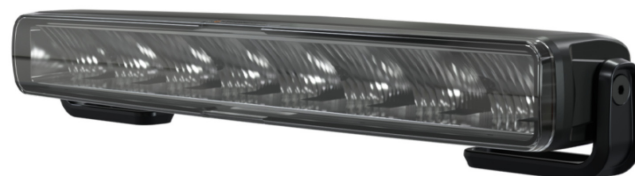
Mirage, 6200lm Standard

Die Mirage kommt mit atemberaubenden 6200 lm und wenn es hart auf hart kommt, einer 7100 lm Boost-Funktion für den Offroad-Verkehr.