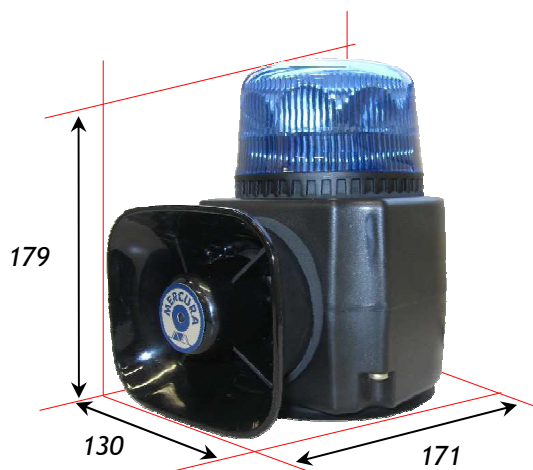
Version support magnétique Poids : 2,4 Kg