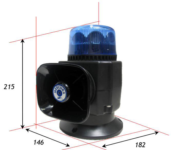
Version support ISO 3 points Poids : 1,6 Kg