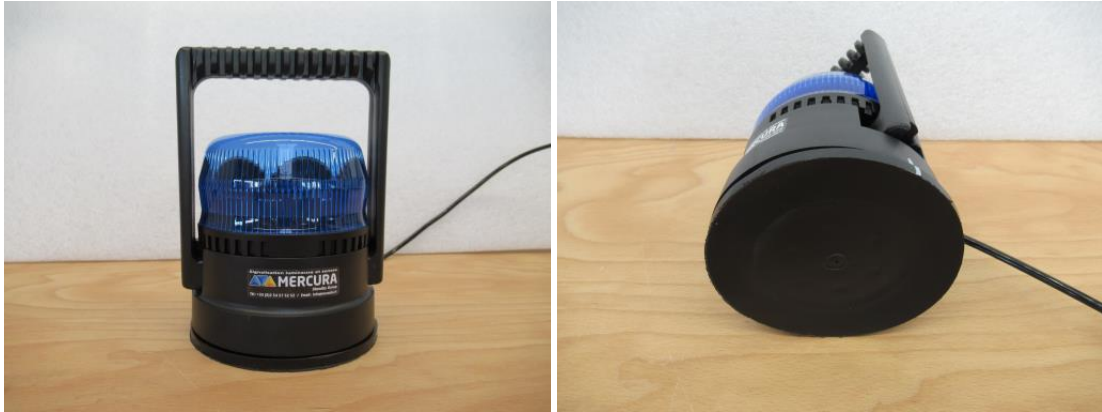
GyroLED - Ansicht vorn, unten mit Saugfuß

Antragsteller : Standby GmbH Typ : GyroLED