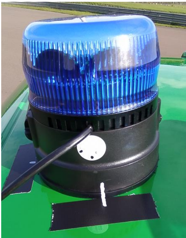
Position vor Prüfung