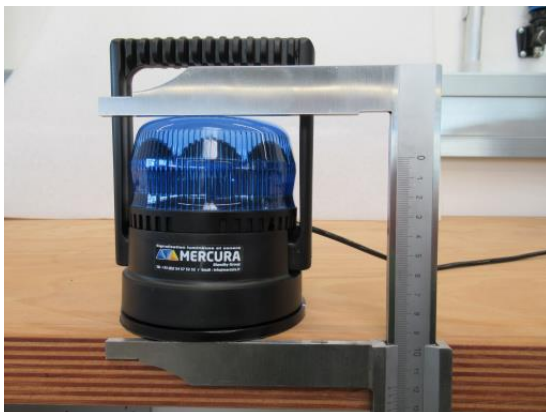
Höhe LED Kennleuchte inkl. Fuß