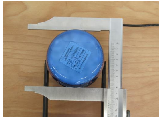
Durchmesser LED Kennleuchte