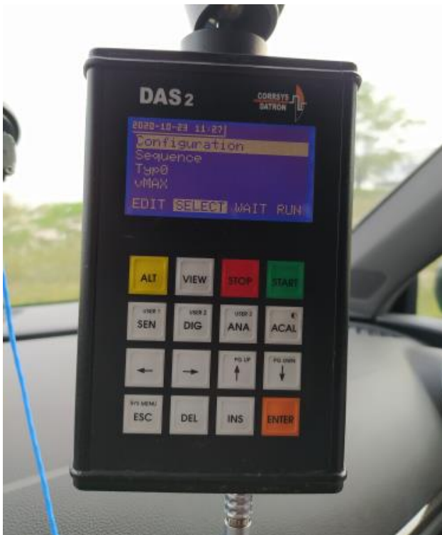
Bedieneinheit und Verzögerungssensor Display