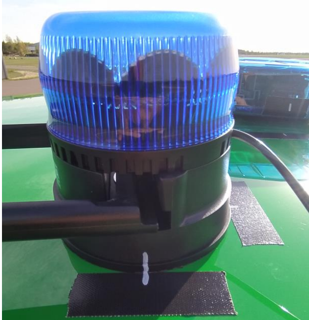
Position vor Prüfung

Antragsteller : Standby GmbH Typ : GyroLED