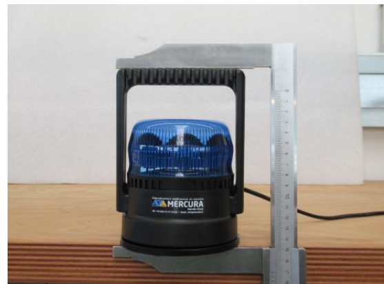
Höhe LED Kennleuchte inkl. Fuß und Griff