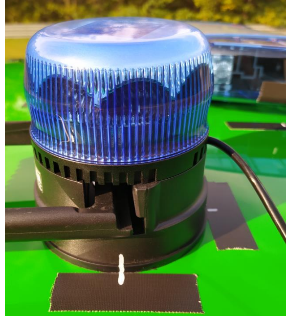
Position nach Prüfung