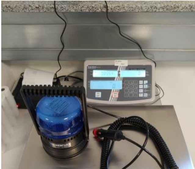
Gewicht LED Kennleuchte inkl. Kabel

Antragsteller : Standby GmbH Typ : GyroLED