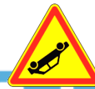
AK31 - Accident