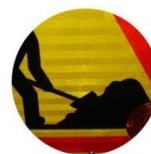
CLASSE B VISIBLE À 250M

-qualité de rétroréflexion 2 fois supérieure -nettement plus visible de loin et en milieu éclairé