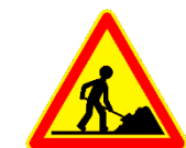
AK5 - Travaux