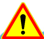
AK14 - Autres dangers