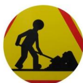
CLASSE A VISIBLE À 80M