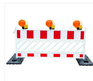
BakoLight sur barrière de chantier