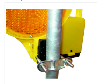
BakoLight avec fixation pour mât